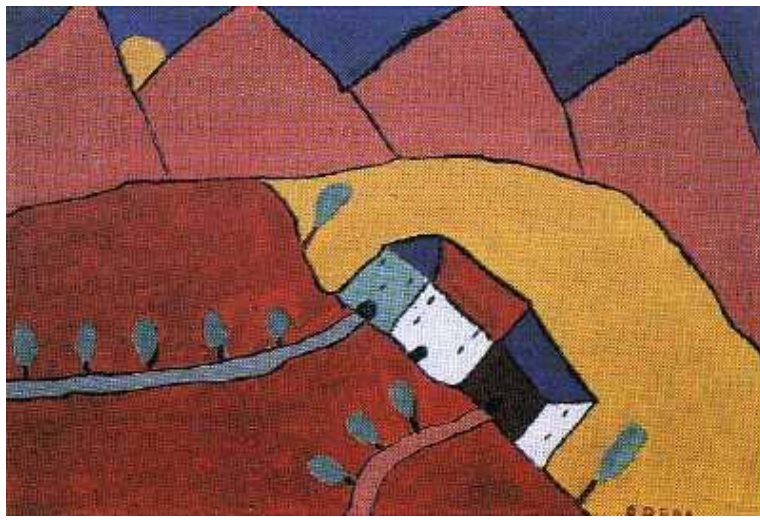
Case in collina Breda, 9 anni 1950

Le priorità dei bambini, nel raccontare il loro mondo, sono diverse dalle nostre: c'è, ad esempio, l'esigenza di "vedere intero", per cui la tastiera di un piano viene raffigurata in verticale, in modo che si possano vedere bene le mani del pianista che si muovono sui tasti; oppure l'esigenza di "vedere attraverso", per cui di un prete si vede il cappello ma anche, in trasparenza, la chierica e una casa viene dipinta mostrandone contemporaneamente "il dentro e il fuori".