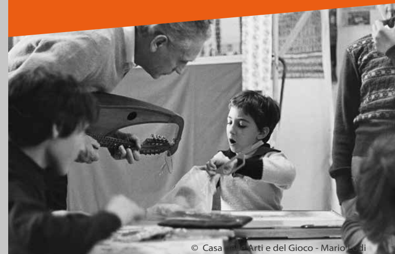
© Casa delle Arti e del Gioco - Mario Lodi

ad eccezione dell'incontro di giovedì 15 febbraio che si terrà in Sala Consulta di Palazzo Comunale - piazza del Comune, 8