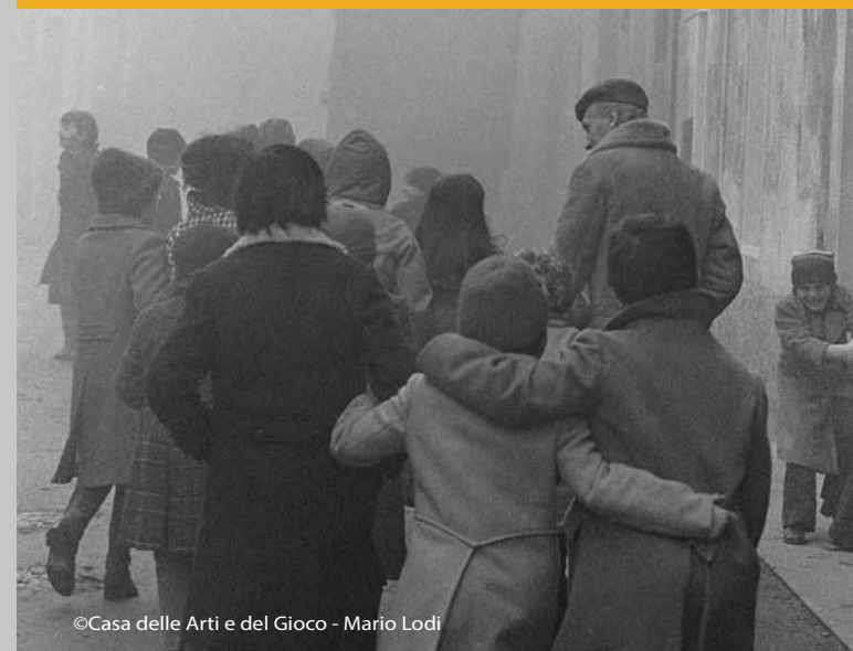
© Casa delle Arti e del Gioco - Mario Lodi